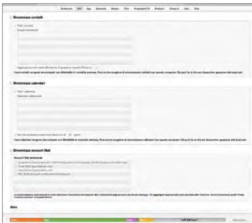
Figura 1.5 - Le opzioni di sincronia per la rubrica e i calendari, e le impostazioni della posta elettronica.

In questa tab (Figura 1.5) trovate tutte le impostazioni di sincronia per i dati della rubrica indirizzi, del calendario e della posta elettronica.