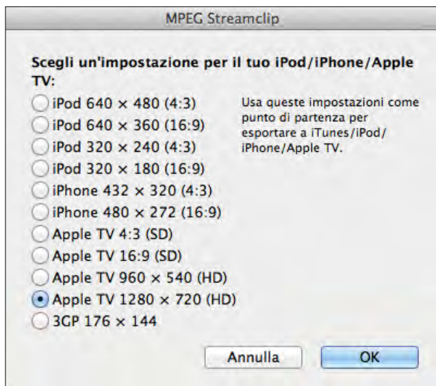
Figura 1.2 - Tra le impostazioni predefinite di MPEG Streamclip ve ne sono due per l'iPhone.

Ora cliccate su Make MP4 per iniziare la conversione. Il tempo richiesto dipende dalla durata del video e dalla velocità di calcolo del processore del vostro computer.