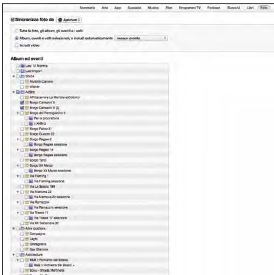
Figura 1.8 - Il menu di iTunes per la sincronia delle fotografie su un iPad.

Potete infine scegliere di sincronizzare le fotografie da una particolare cartella situata sul vostro hard disk. Questa funzione sarà molto utile per gli utenti Windows, che non hanno a disposizione software come iPhoto. iTunes, tuttavia, è compatibile con Adobe Album e Adobe Elements, che in questo caso possono fare le veci di iPhoto pur non essendo la stessa cosa.