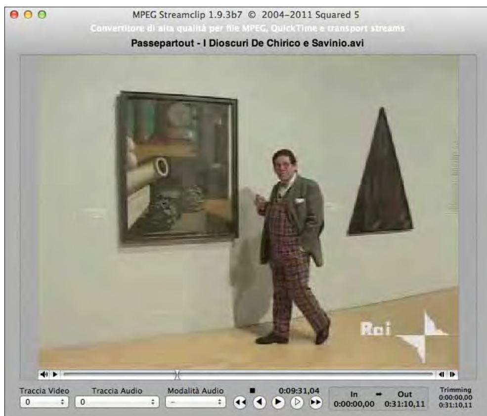
Figura 1.1 - Un filmato pronto a essere convertito per iOS con MPEG Streamclip.

Il suo utilizzo è molto semplice. Basta trascinare un video dentro la schermata principale del software e poi scegliere le impostazioni corrette per il dispositivo (Figura 1.1).