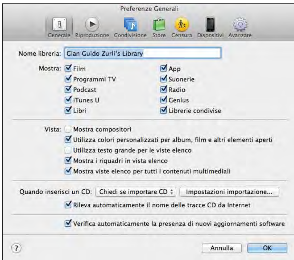
Figura 1.3 - Le impostazioni generali di iTunes.