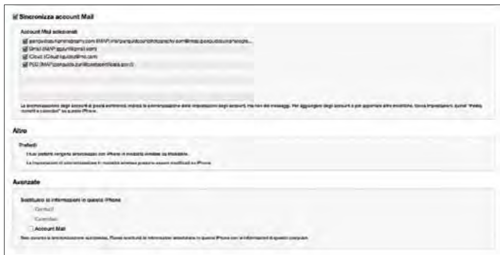
Figura 1.6 - Per scegliere quali indirizzi di posta elettronica sincronizzare, basta semplicemente selezionarli.

Se si hanno diversi indirizzi di posta elettronica, è molto facile impostare quelli che si vogliono sincronizzare: basta spuntare la relativa casella come mostrato in Figura 1.6.