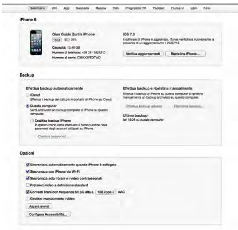
Figura 1.4 - La schermata iniziale delle impostazioni di un iPhone in iTunes.

le volte che il vostro iPhone o iPad inizierà a dare segni di cedimento, come strani messaggi di errore o instabilità. Inoltre, potrete aggiornare il sistema operativo non appena vi sarà un aggiornamento disponibile, procedura eseguibile anche direttamente da iOS.