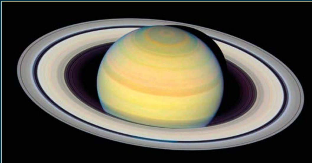
Saturno fotografato il 22 marzo del 2004 con il Telescopio Spaziale Hubble.

L'astronomia non è riservata soltanto agli scienziati o a chi può accedere ad apparecchiature costose e complicate, ma può essere affrontata da chiunque. Tutti possono ammirare gli spettacoli che colpirono Galileo, Newton, Herschel ed altri astronomi famosi. Anche uno studente potrebbe essere il primo a scorgere una cometa e pure una massiccia potrebbe seguire le varie fasi di un'eclisse. Le precise osservazioni di una stella variabile fatte da un dilettante potrebbero fornire dati utili ad un osservatorio professionale.