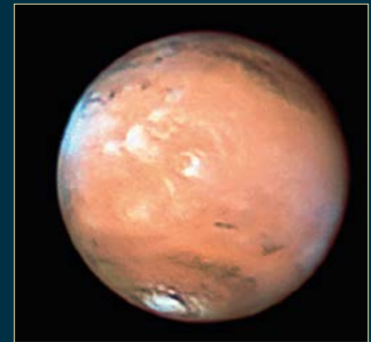
Sopra, una bella immagine di Marte, ottenuta dal telescopio spaziale Hubble il 26 agosto 2003. A destra, una delle migliori fotografie di Marte mai ottenute dalla superficie terrestre. Venne realizzata il 16 marzo 2012 con un riflettore Dall-Kirkham da 51 cm. Sono visibili le nubi bianche orografiche lungo i fianchi del Monte Olympus (al centro) e la disuniformità della calotta polare boreale (in basso).