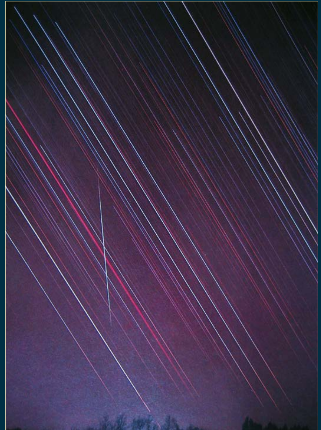
Meteora ripresa con un obiettivo da 100 mm a f/2,8. Pellicola diapositiva da 100 ISO.

teore telescopiche sono più deboli di quelle visibili ad occhio nudo. Richiedono strumenti a corto fuoco, luminosi e bassi ingrandimenti; per esempio un 80 mm con focale sui 500 mm e potere di 20x. Il campo dell'oculare non dovrebbe essere inferiore ai 50°-55°; ancora meglio un oculare grandangolare che permette una visione a 60°-70°, in modo che il campo reale raggiunga i 2°,5. Molto adatti sono anche i grossi binocoli destinati alla ricerca di comete. Usando un 25x105 e un 11x80, G.E.D. Alcock contò oltre 200 meteore nell'arco di 8 mesi. In media si osserva una meteora telescopica ogni ora. Spesso le meteore telescopiche sembrano relativamente lente e il loro percorso si segue facilmente. Alcune si spostano così lentamente da essere distinte come punti di luce stellare che si spengono dopo solo un grado o meno di percorso. Si tratta, evidentemente, di meteore dirette quasi esattamente lungo la linea visuale dell'osservatore.