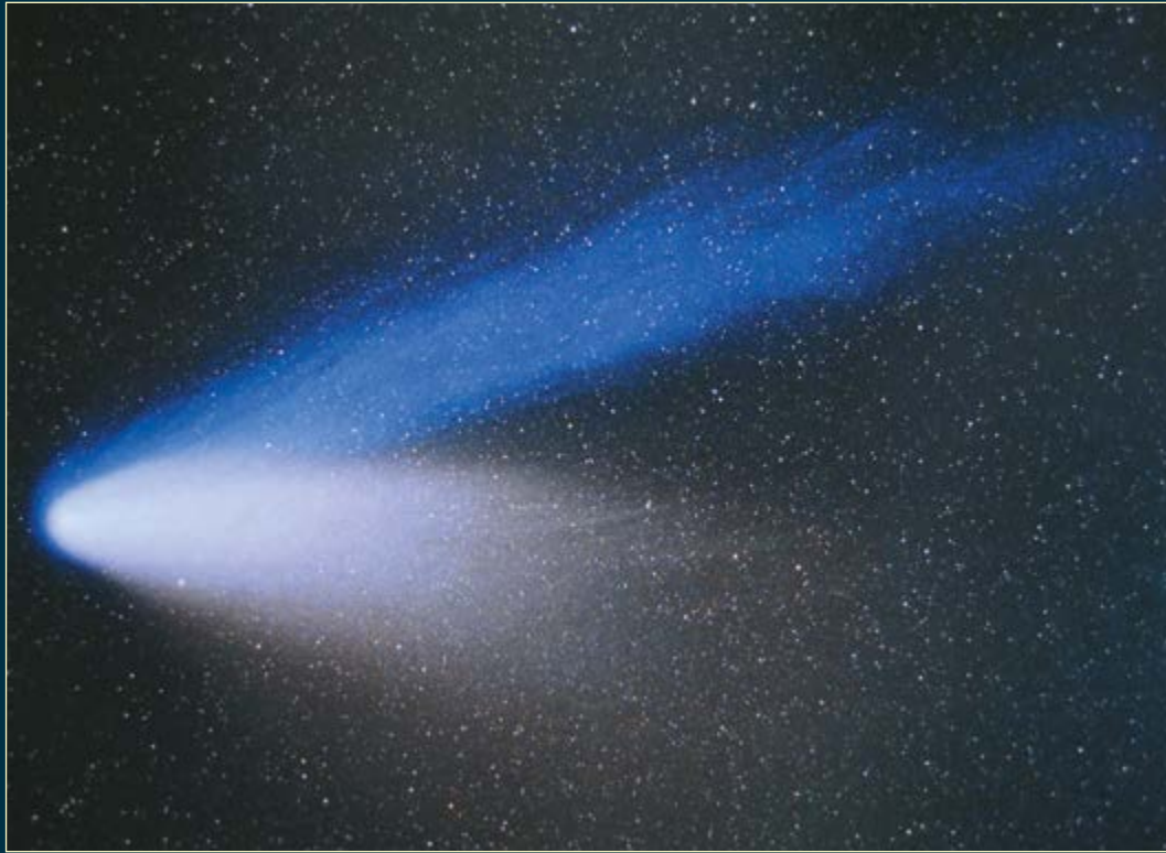
La cometa Hale-Bopp fotografata l'8 marzo 1997 con un rifrattore apocromatico da 10 cm a corto fuoco. Posa di 8 minuti su pellicola da 1000 ISO.