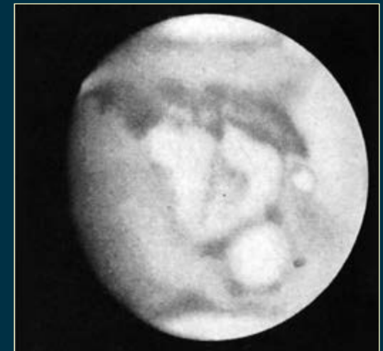
Due disegni di Marte ottenuti da un astronomo professionista con un grande rifrattore. Entrambi sono stati delineati da E.M. Antoniadi con il telescopio da 83 cm (!) di Meudon.