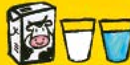
il latte e l'acqua