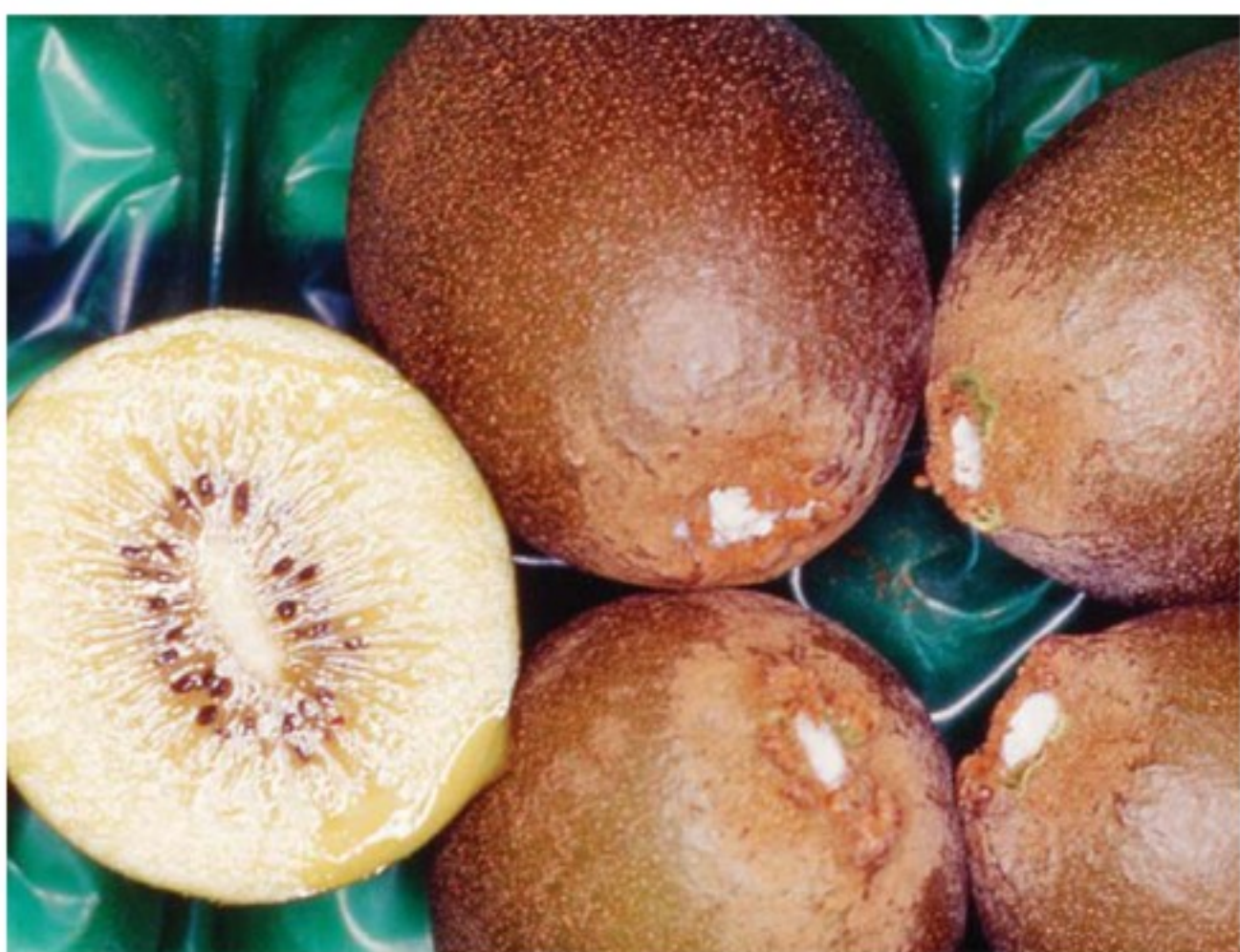
Frutti con nidi di Icius congener