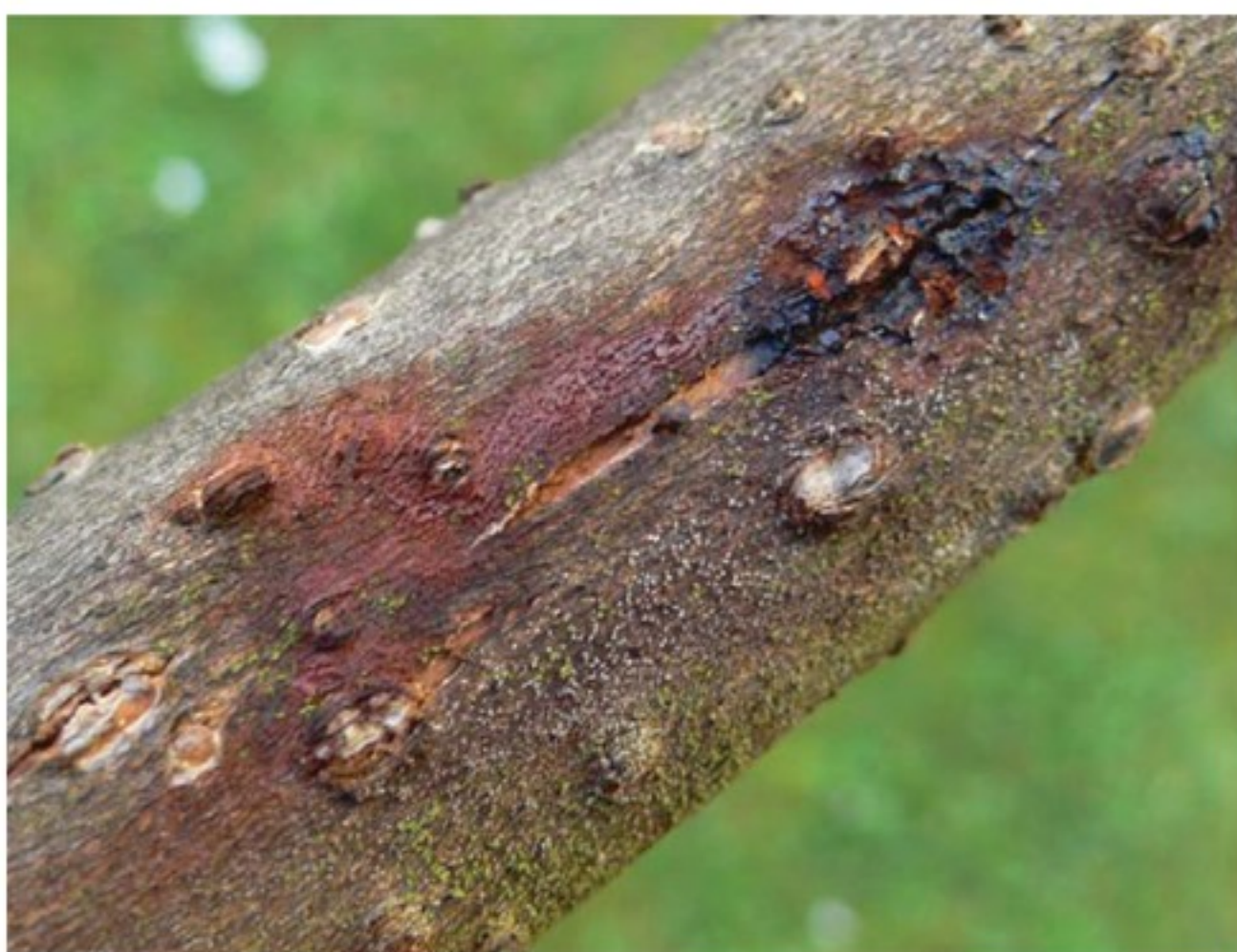
Cancro corticale batterico