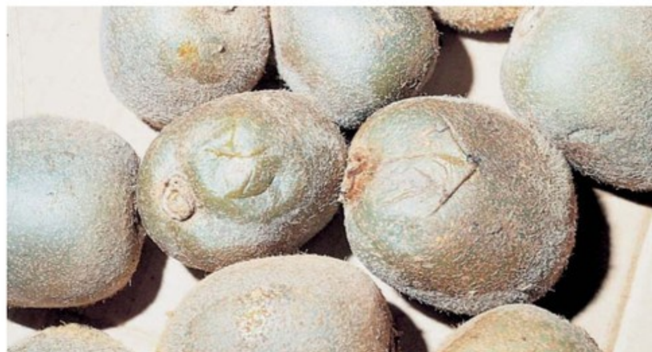
Rammollimento dei frutti infestati dalla mosca