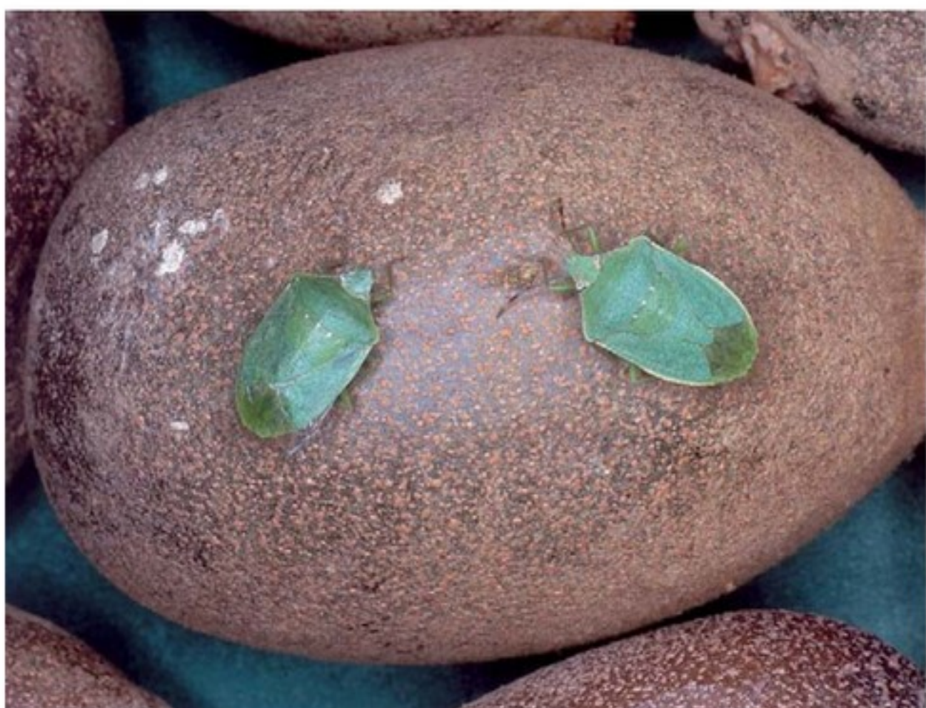
Adulti di Nezara viridula con grumi salivari