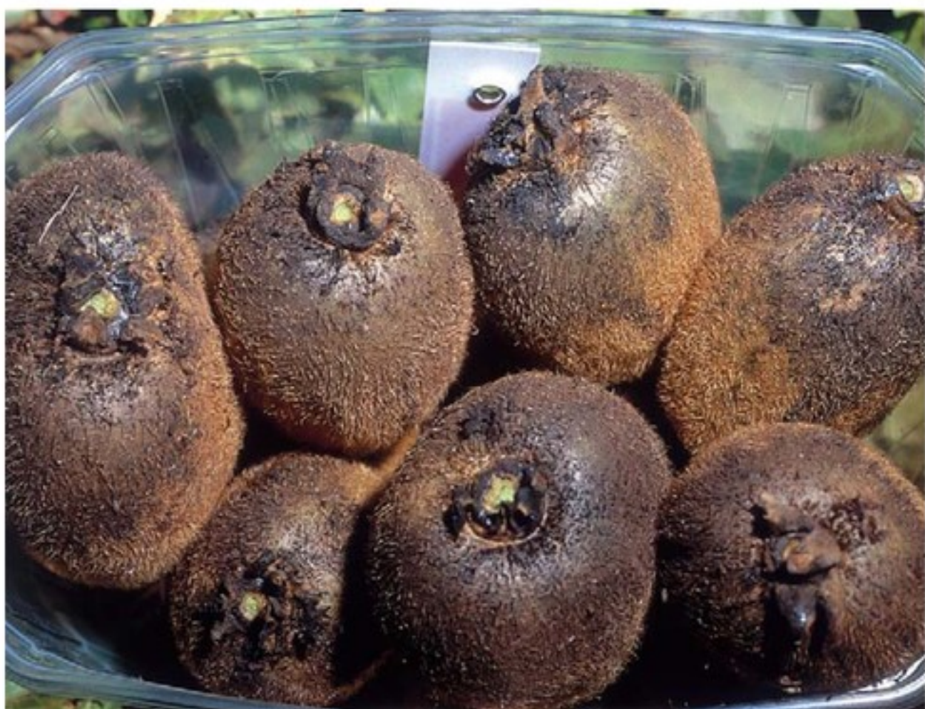
Frutti danneggiati dalla Metcalfa