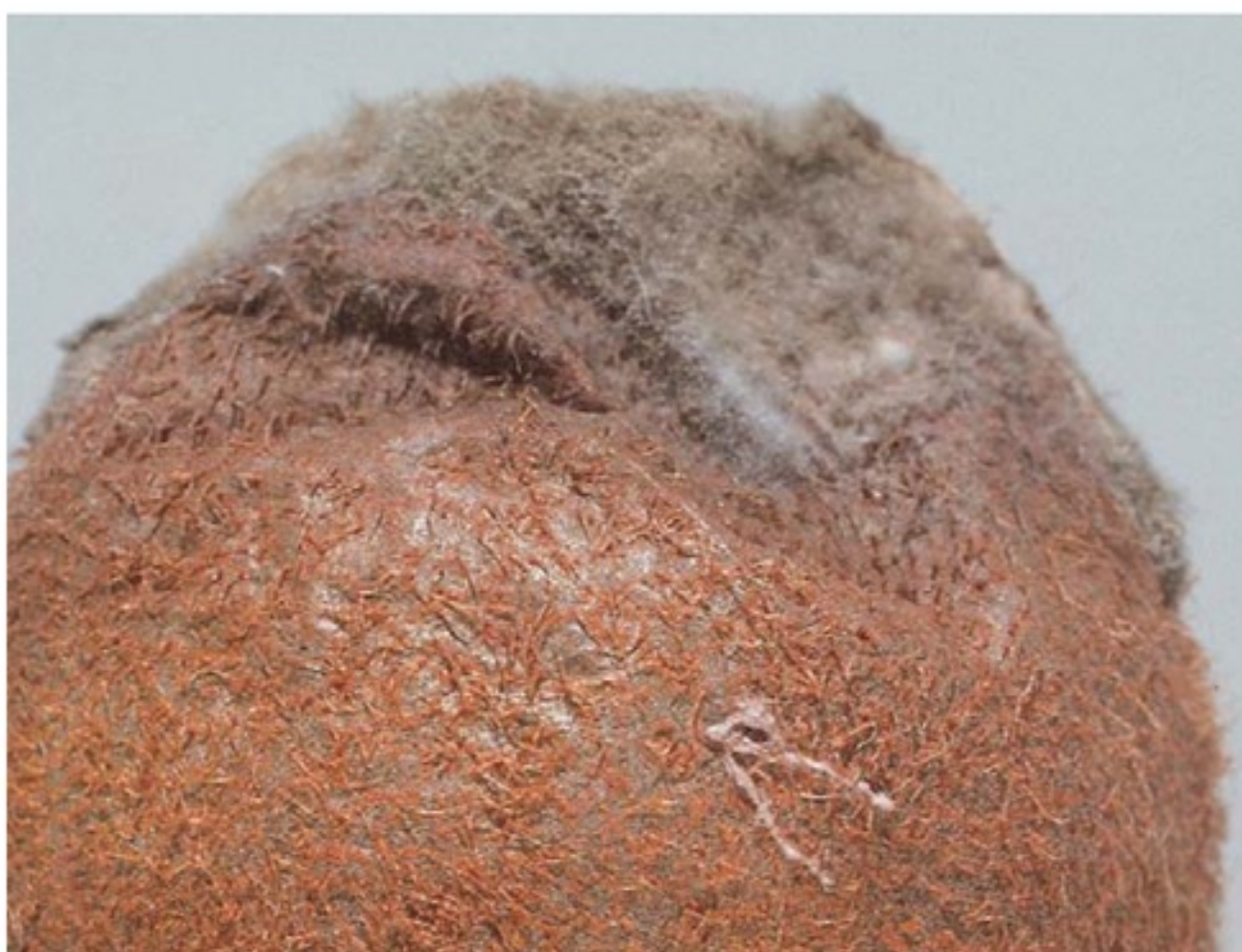
Frutto affetto da muffa grigia