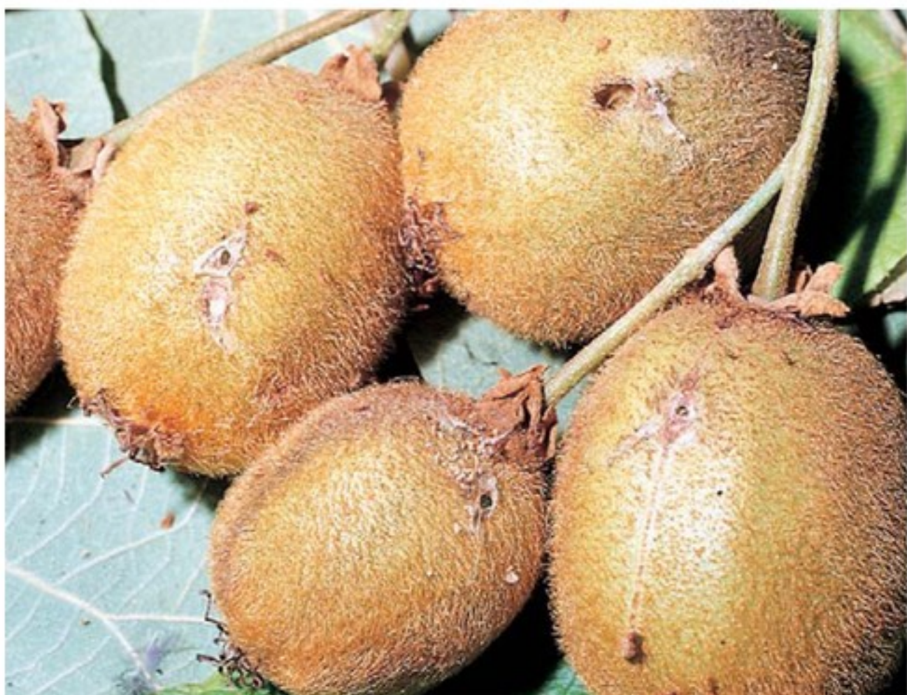
Danni da eulia