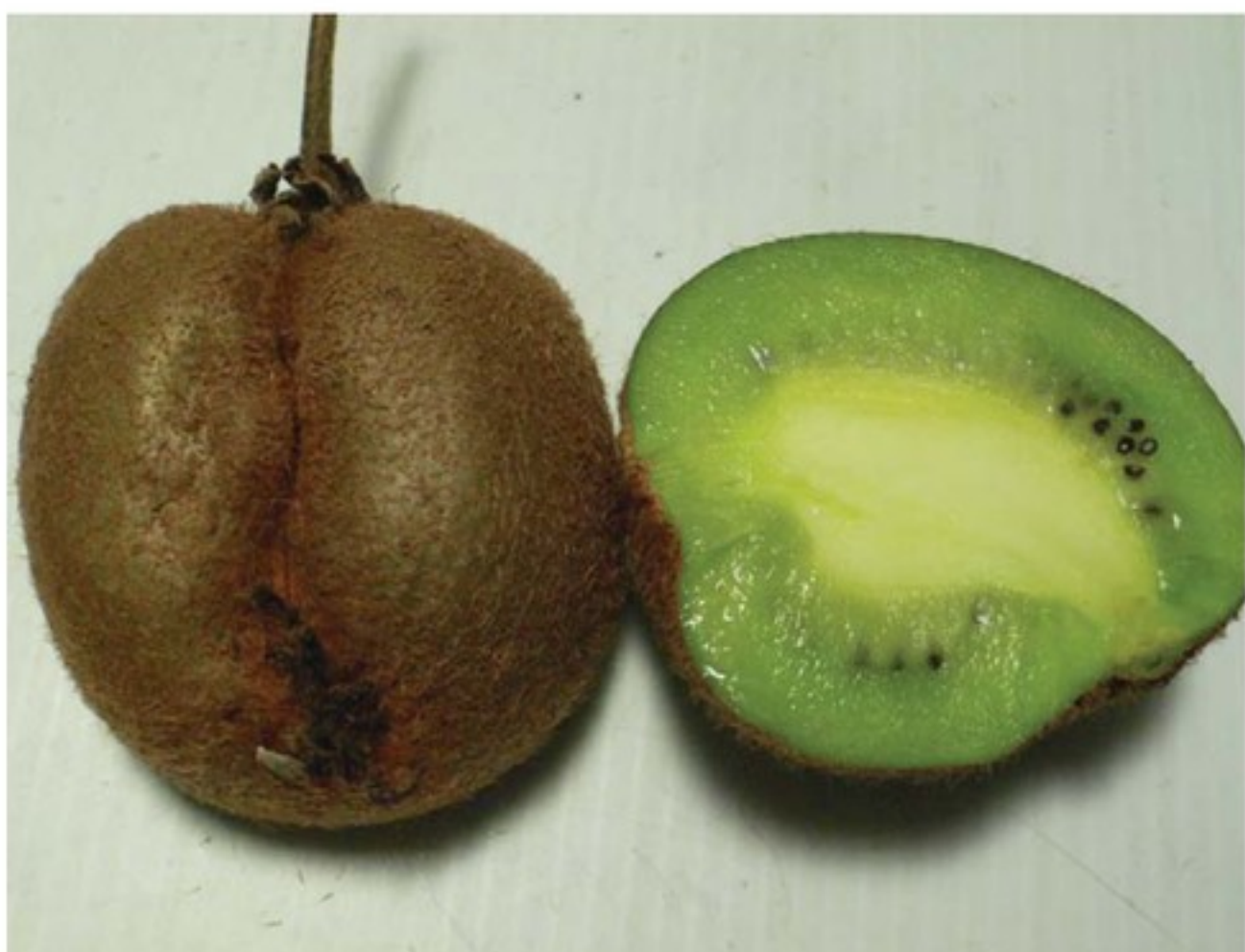
Frutti derivati da incompleta fecondazione