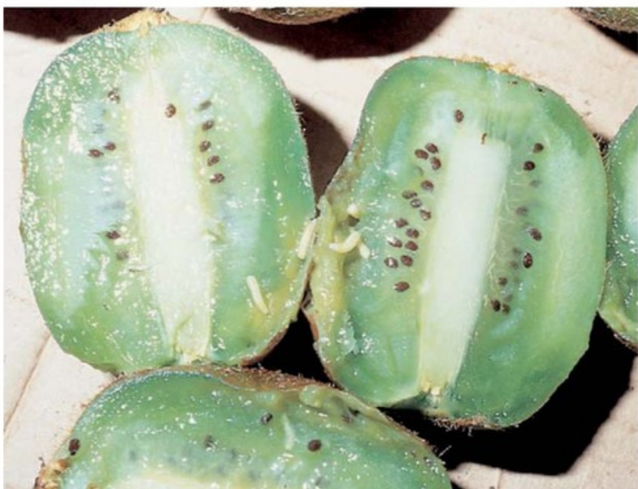
Frutti infestati dalle larve di Ceratitis capitata