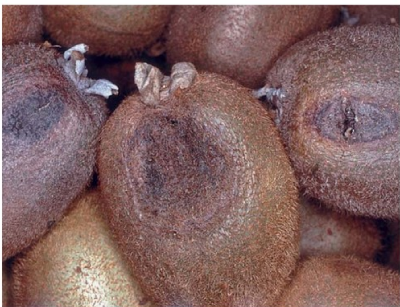
Frutti con colpo di sole