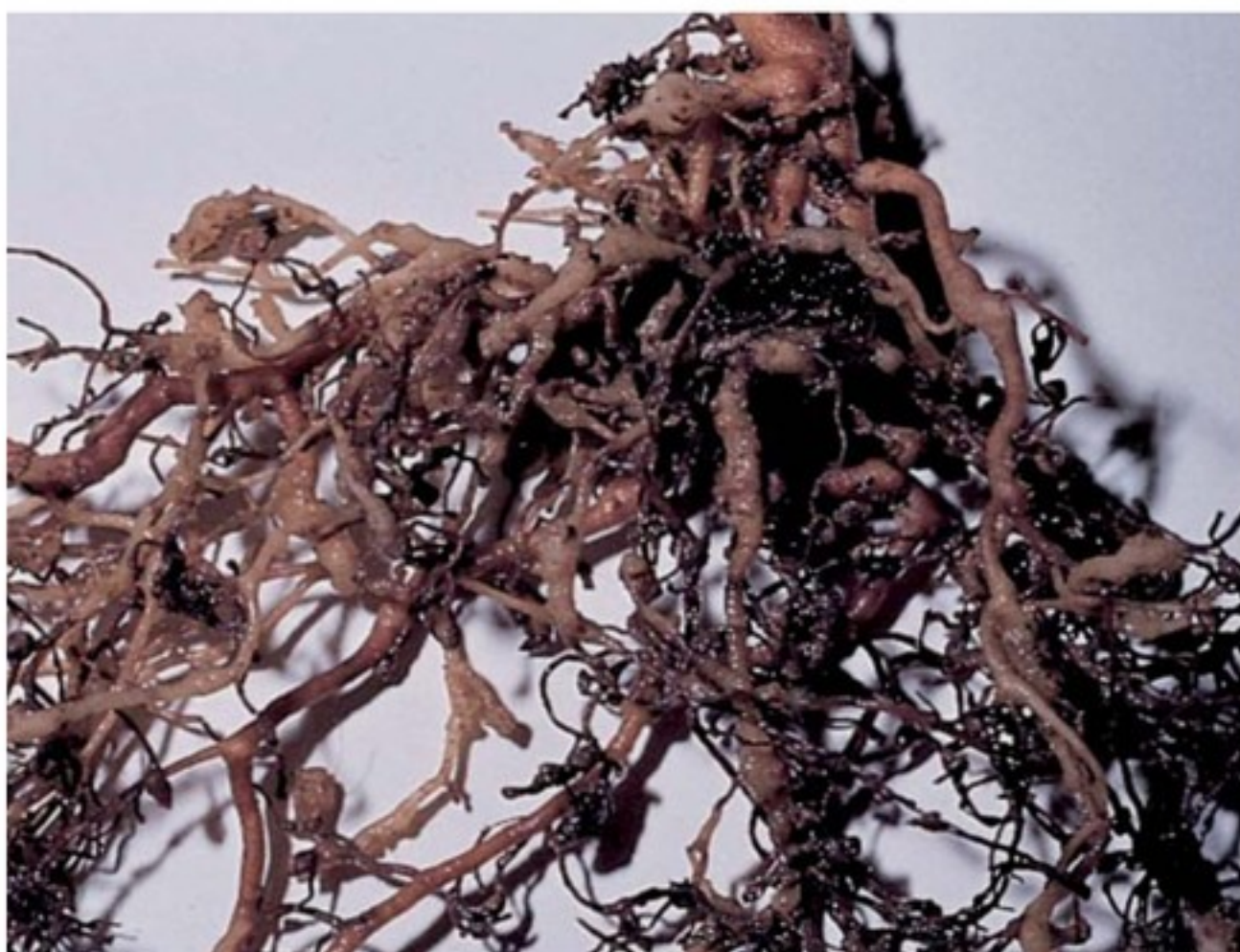
Apparato radicale infestato da nematodi galligeni