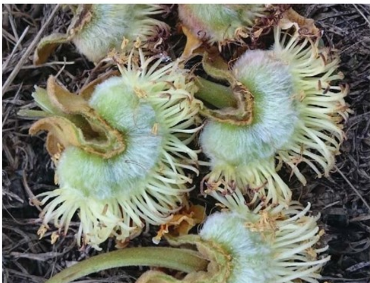
Malformazioni "a ventaglio"