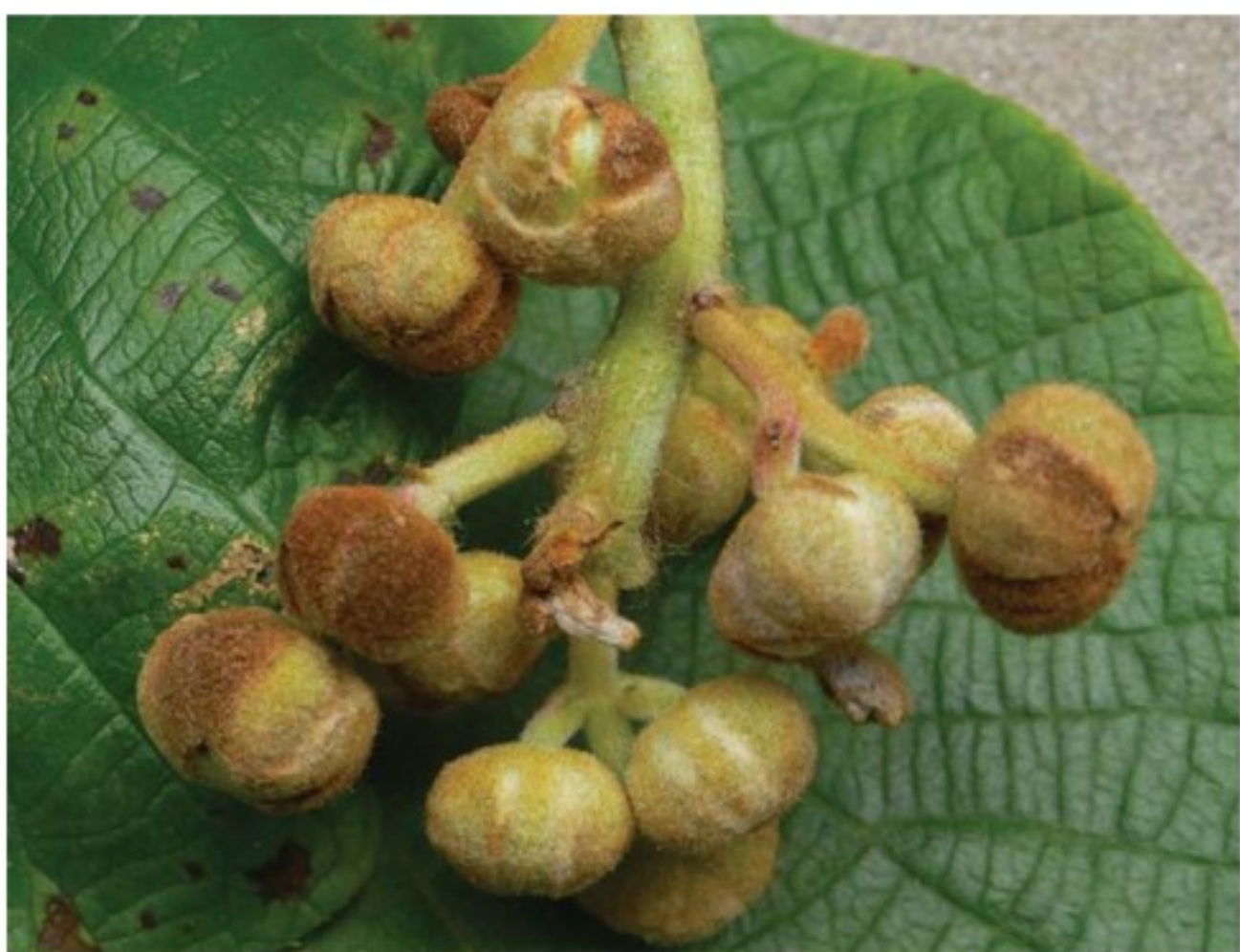
Fiori colpiti da Pseudomonas syringae pv. actinidiae