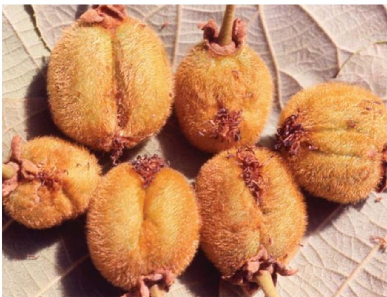
Danni da gelo