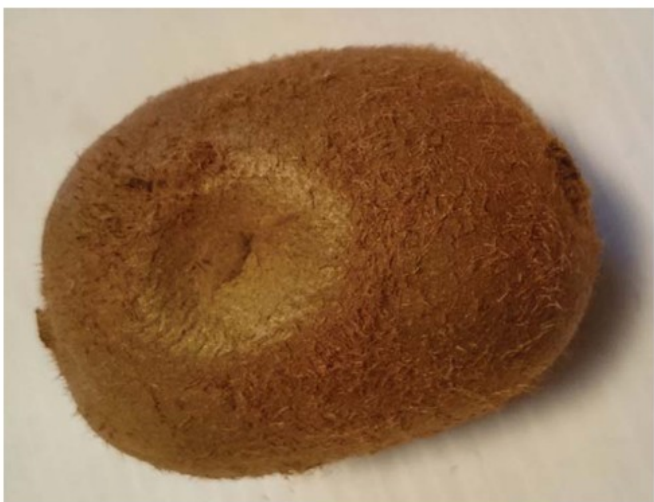
Frutto colpito da fialoforosi