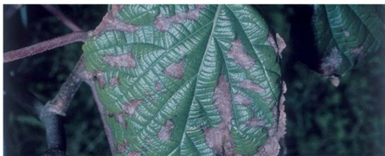
Foglie di rami affetti da deperimento del legno.