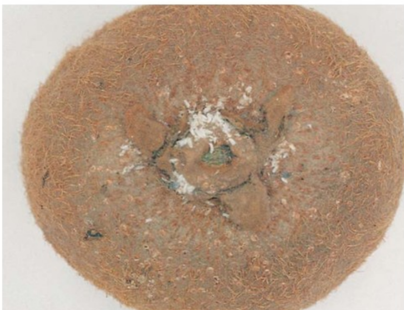
Frutto infestato dai follicoli maschili di Pseudaulacaspis pentagona