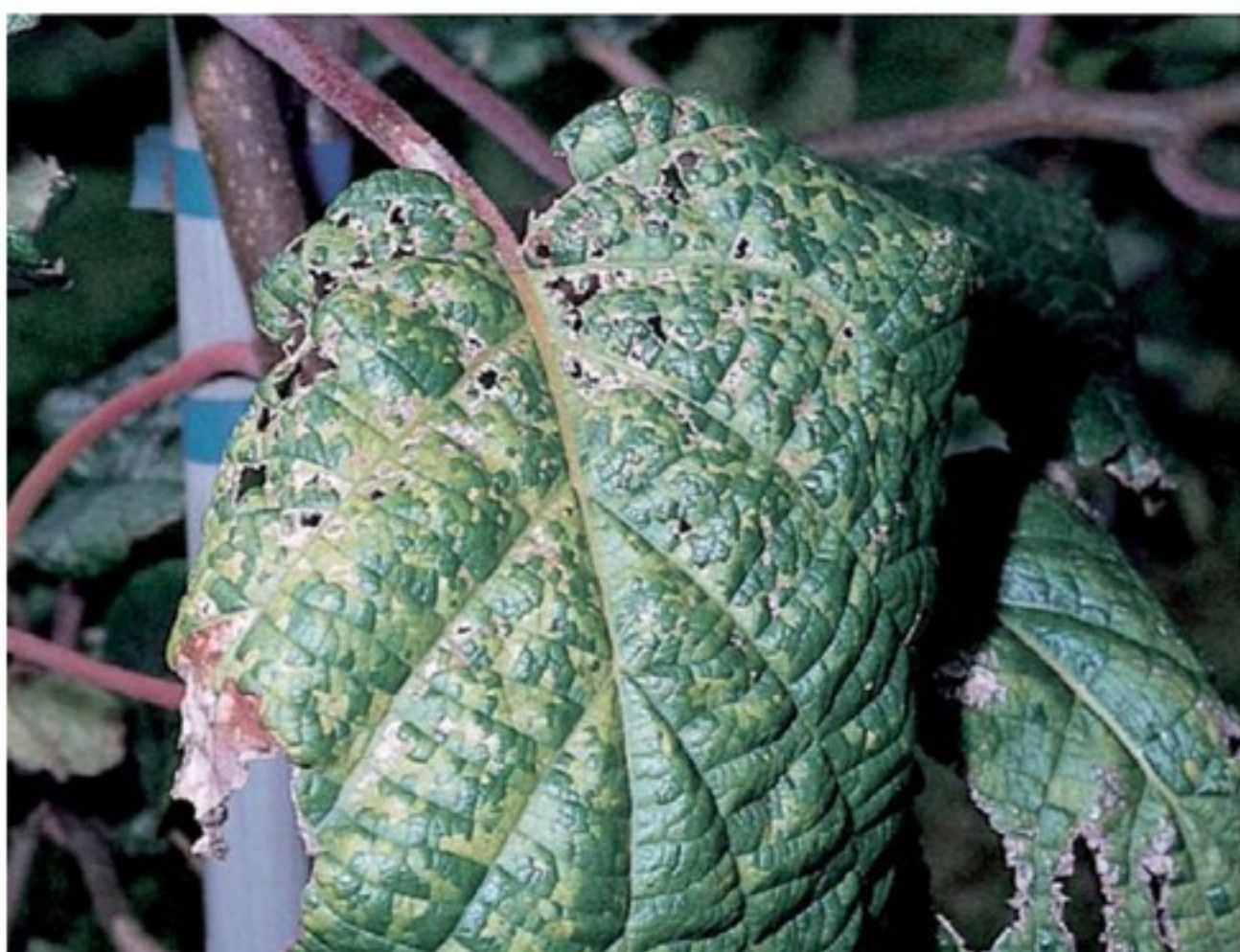
Danni da gelo: mosaicatura poligonale del lembo