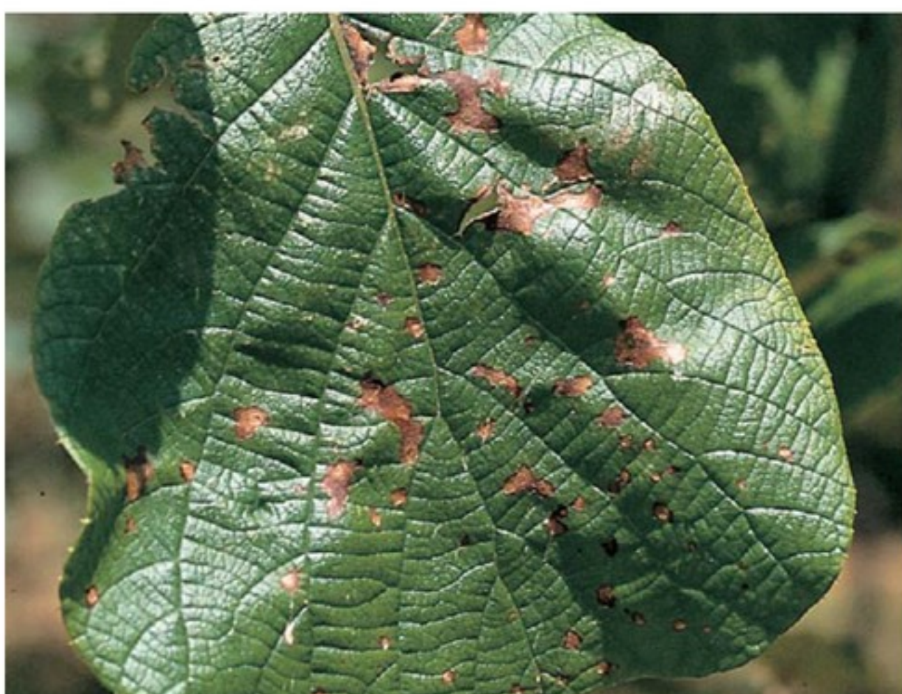
Maculature di origine batterica