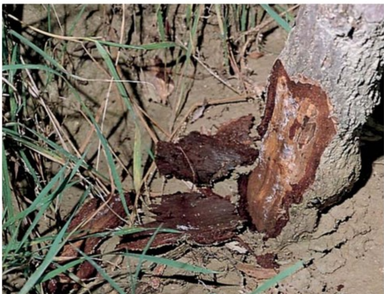
Pianta affetta da marciume del colletto