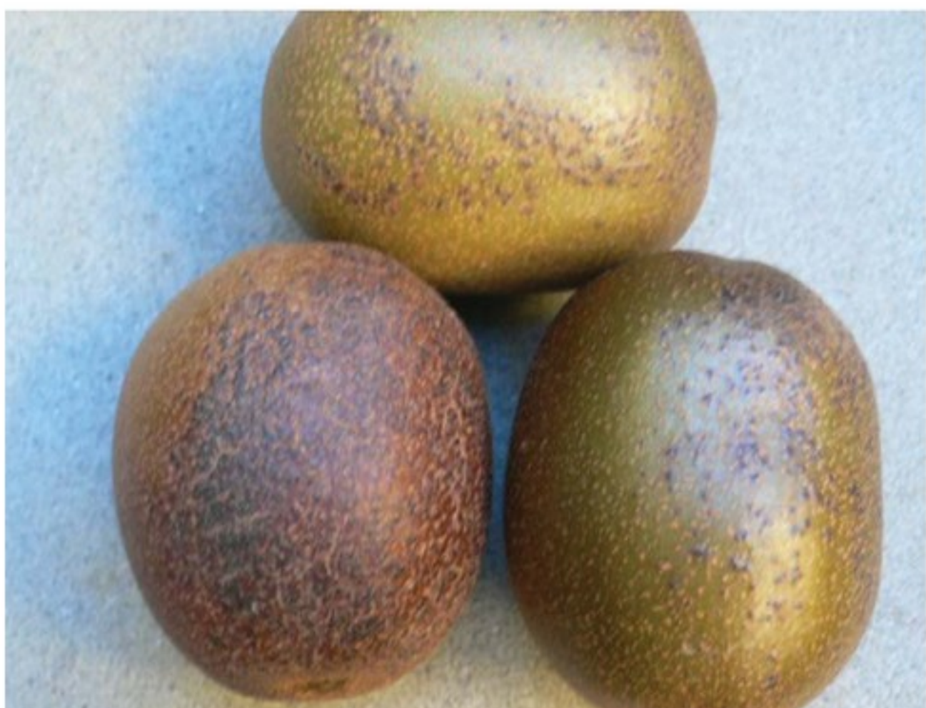
Effetti fitotossici causati da chelati fogliari