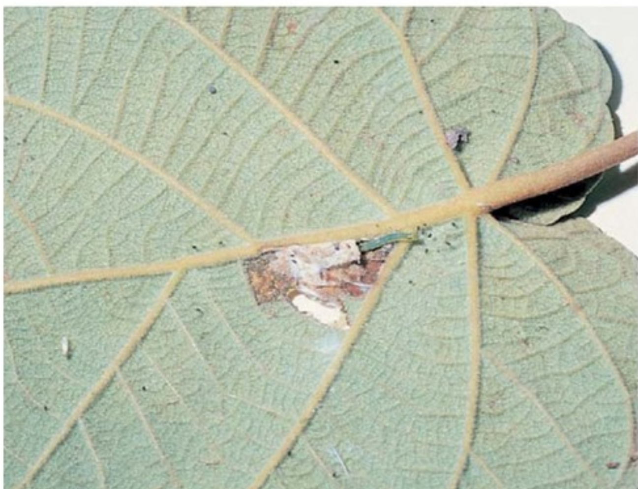
Foglia infestata da eulia