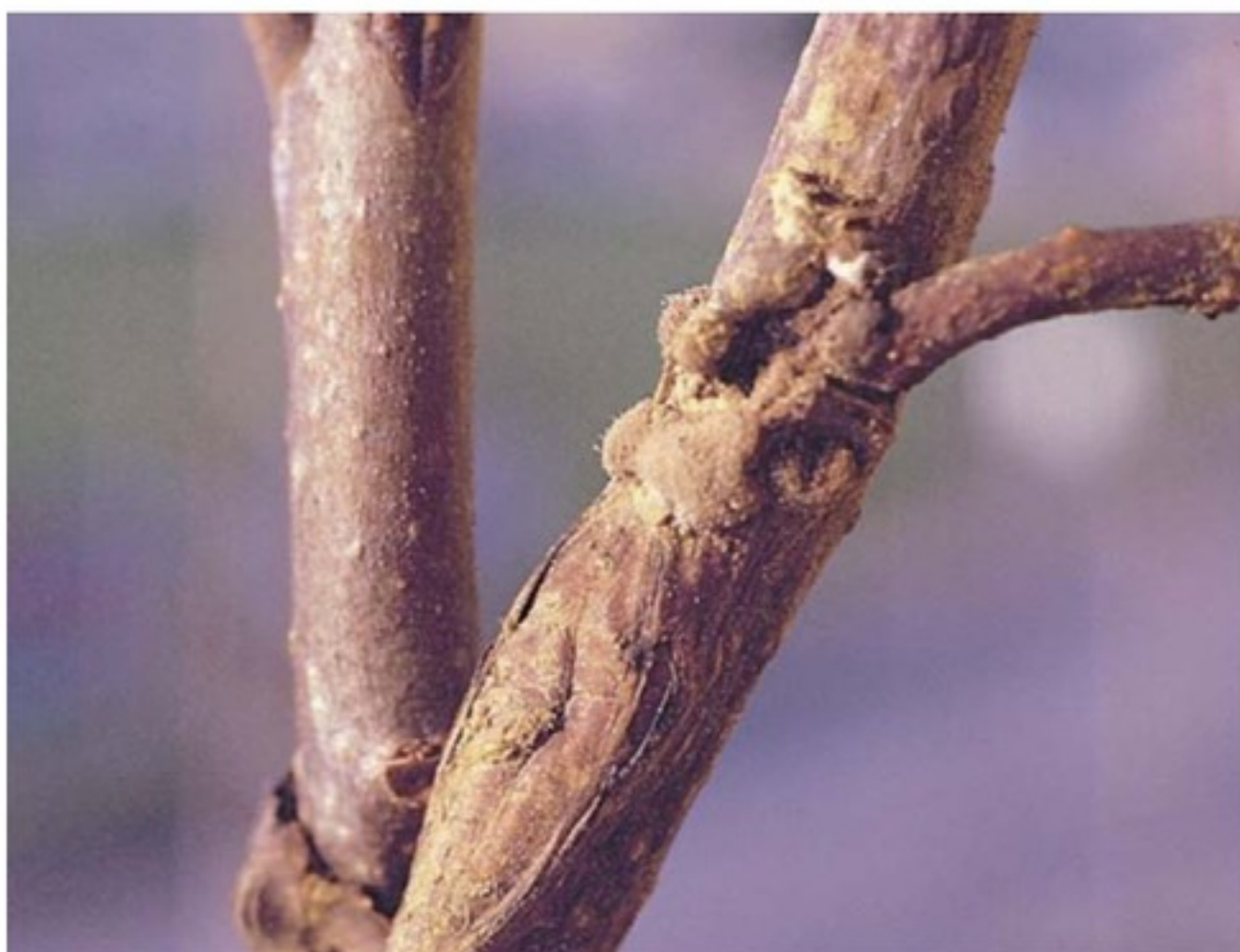
Cuscinetti di muffa grigia su un ramo