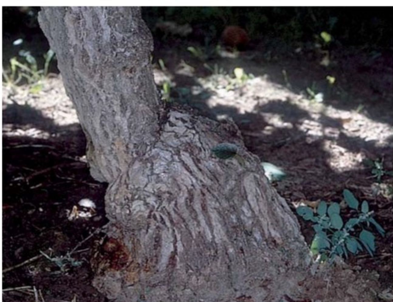
Ceppo affetto da "elefantiasi"