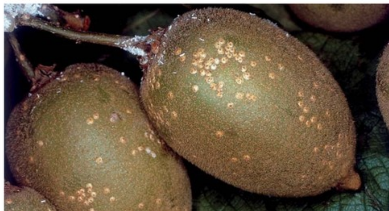
Frutto di Hort 16A infestato dai follicoli femminili di P. pentagona