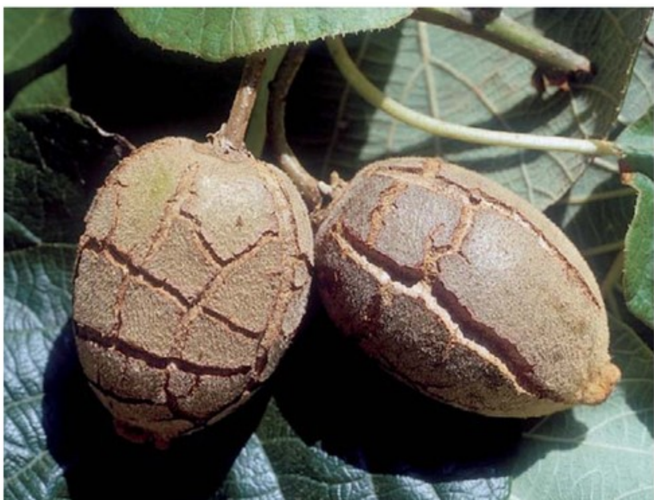
Frutti affetti da "cracking"