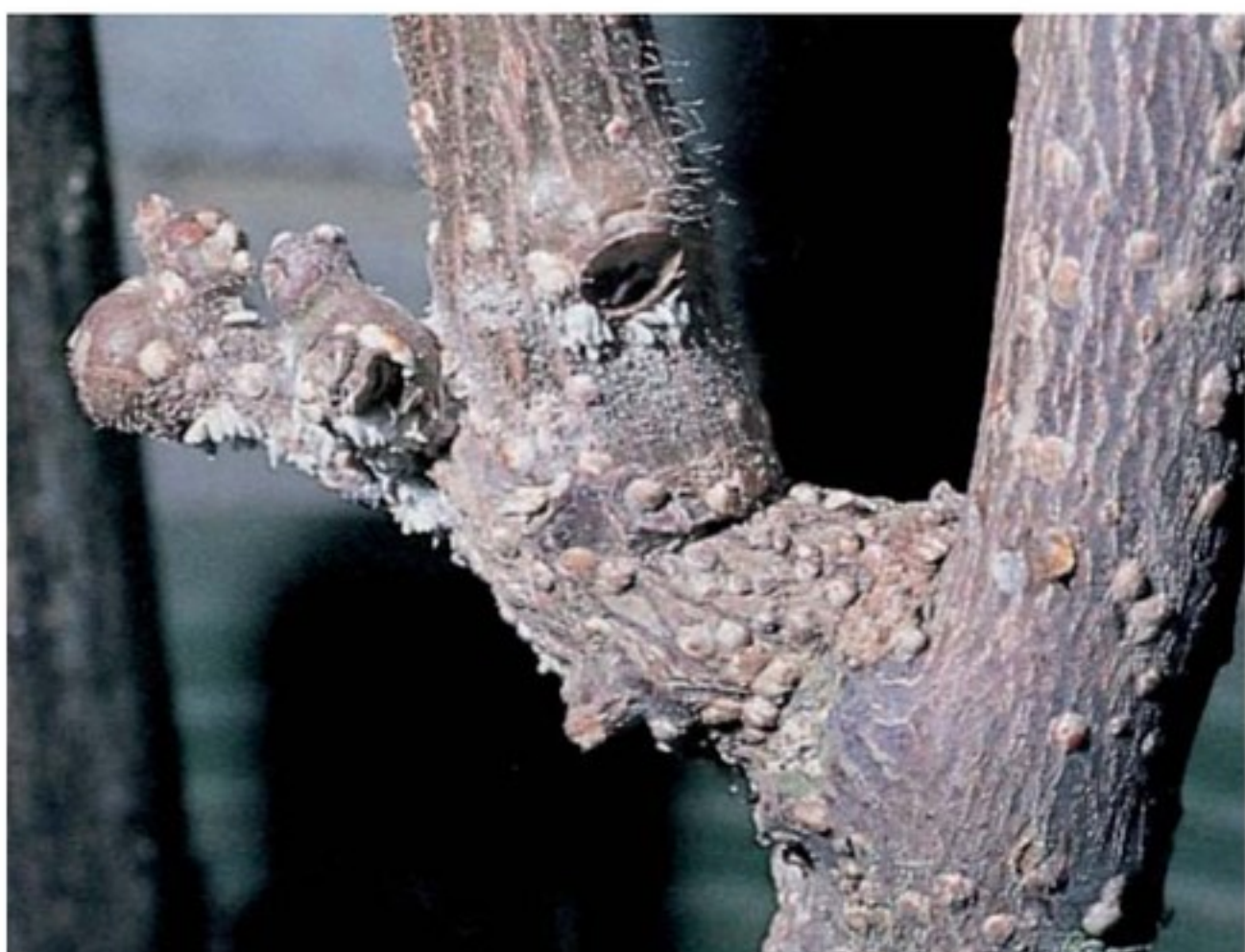
Pianta infestata da Pseudaulacaspis pentagona