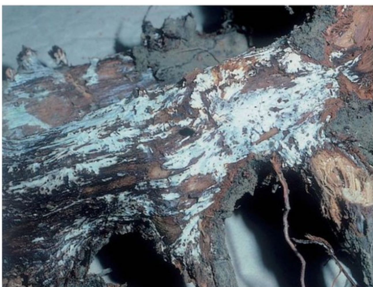
Attacco di Armillaria mellea

In sezione la parte ingrossata presenta imbrunimenti del legno della zona centrale.