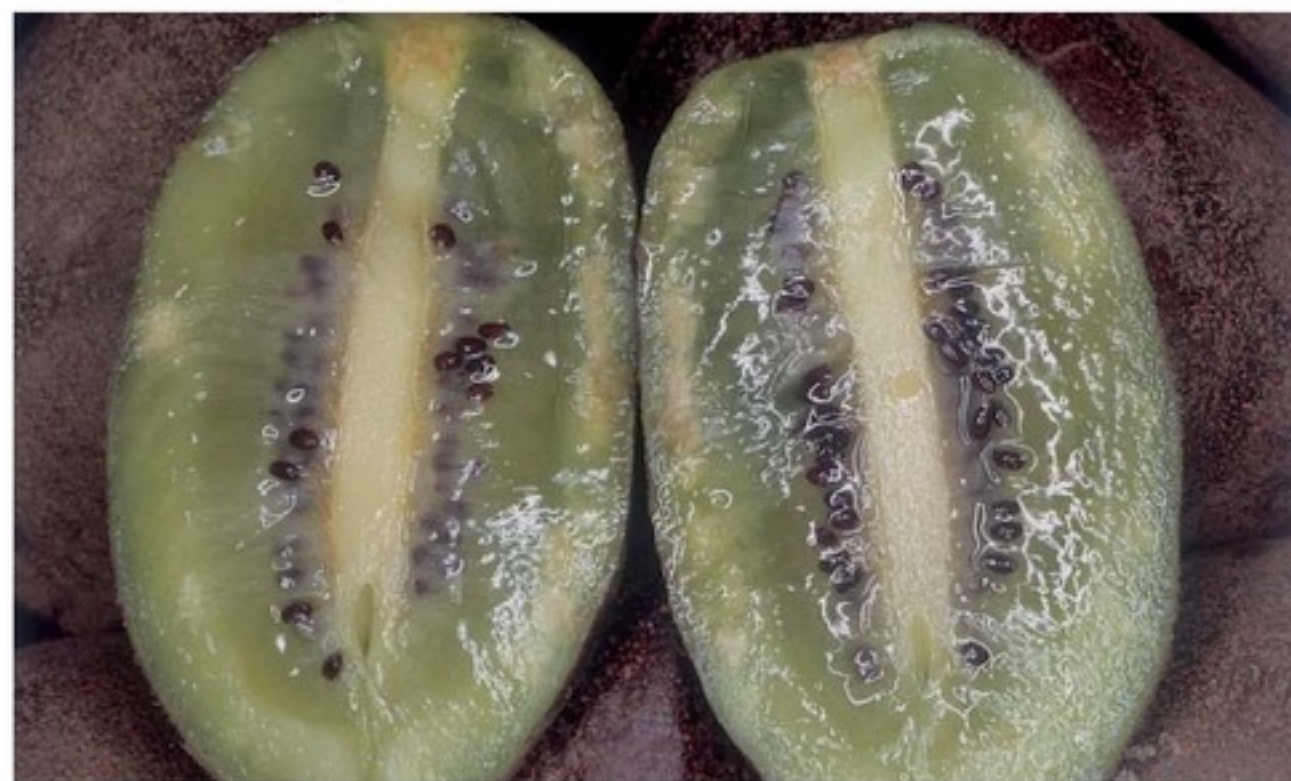
Aspetto di un frutto con porzioni suberificate, di colore bianco corrispondenti alle punture delle cimici