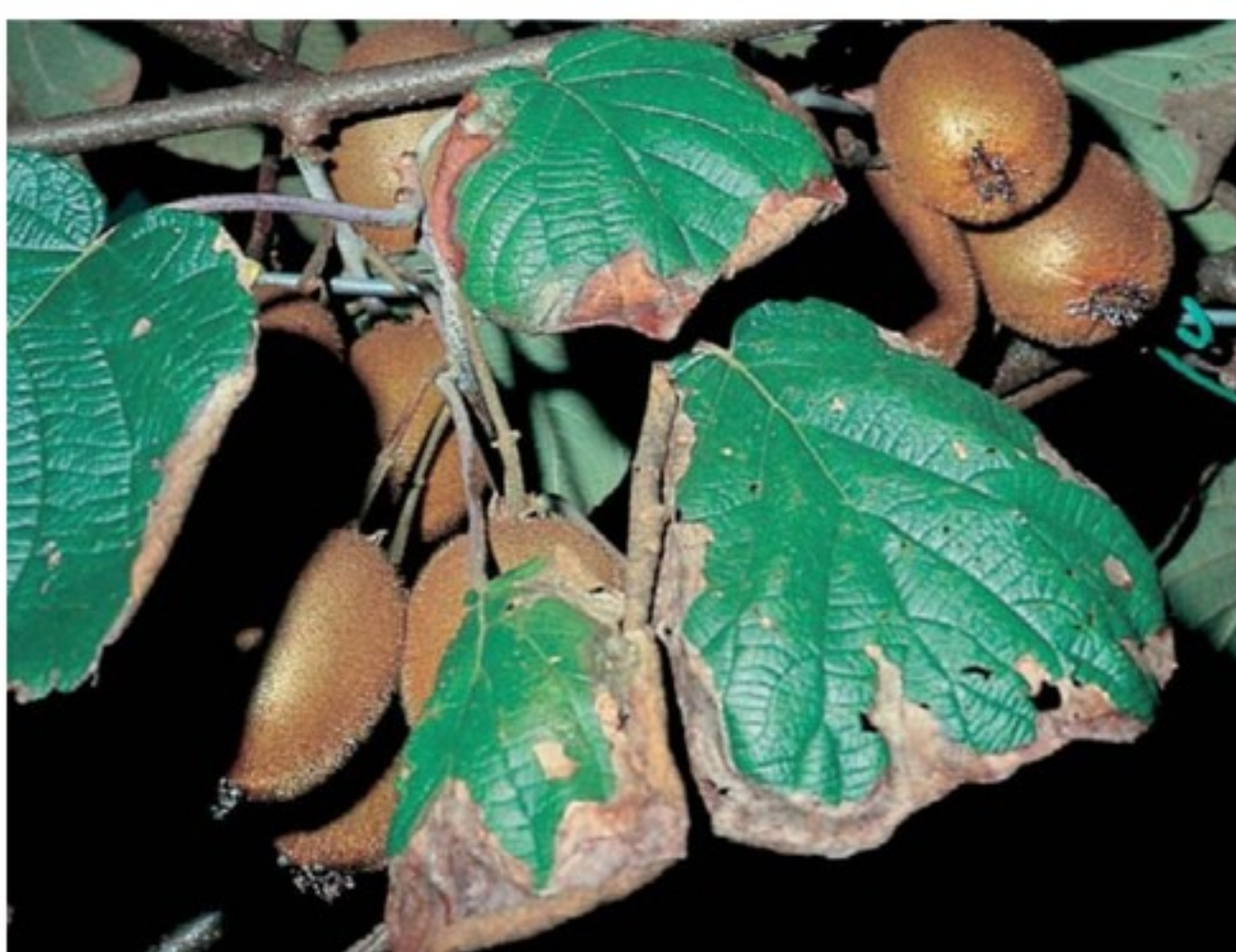
Foglie, con necrosi del bordo per forte attacco delle cicaline