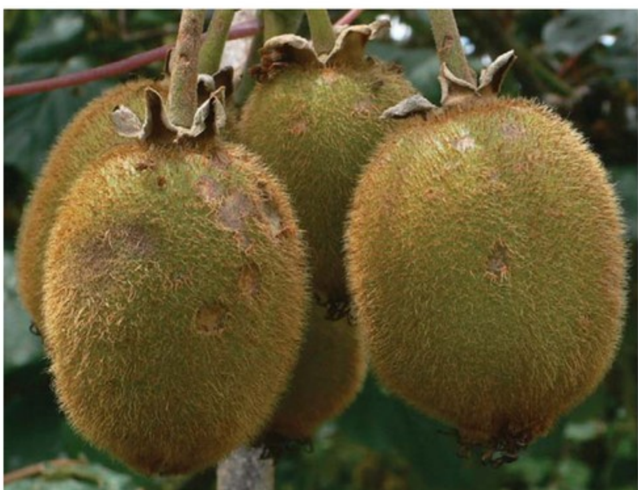
Frutti danneggiati dalla grandine