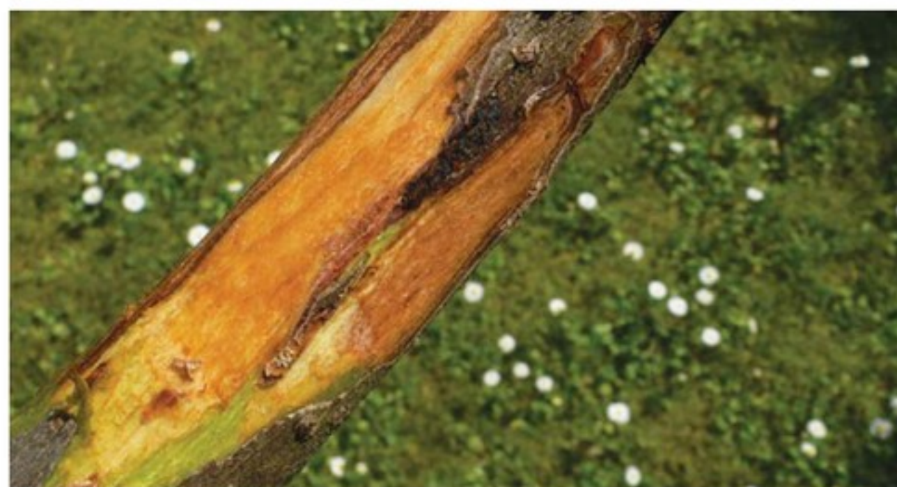
Arrossamenti sottocorticali causati dalla batteriosi