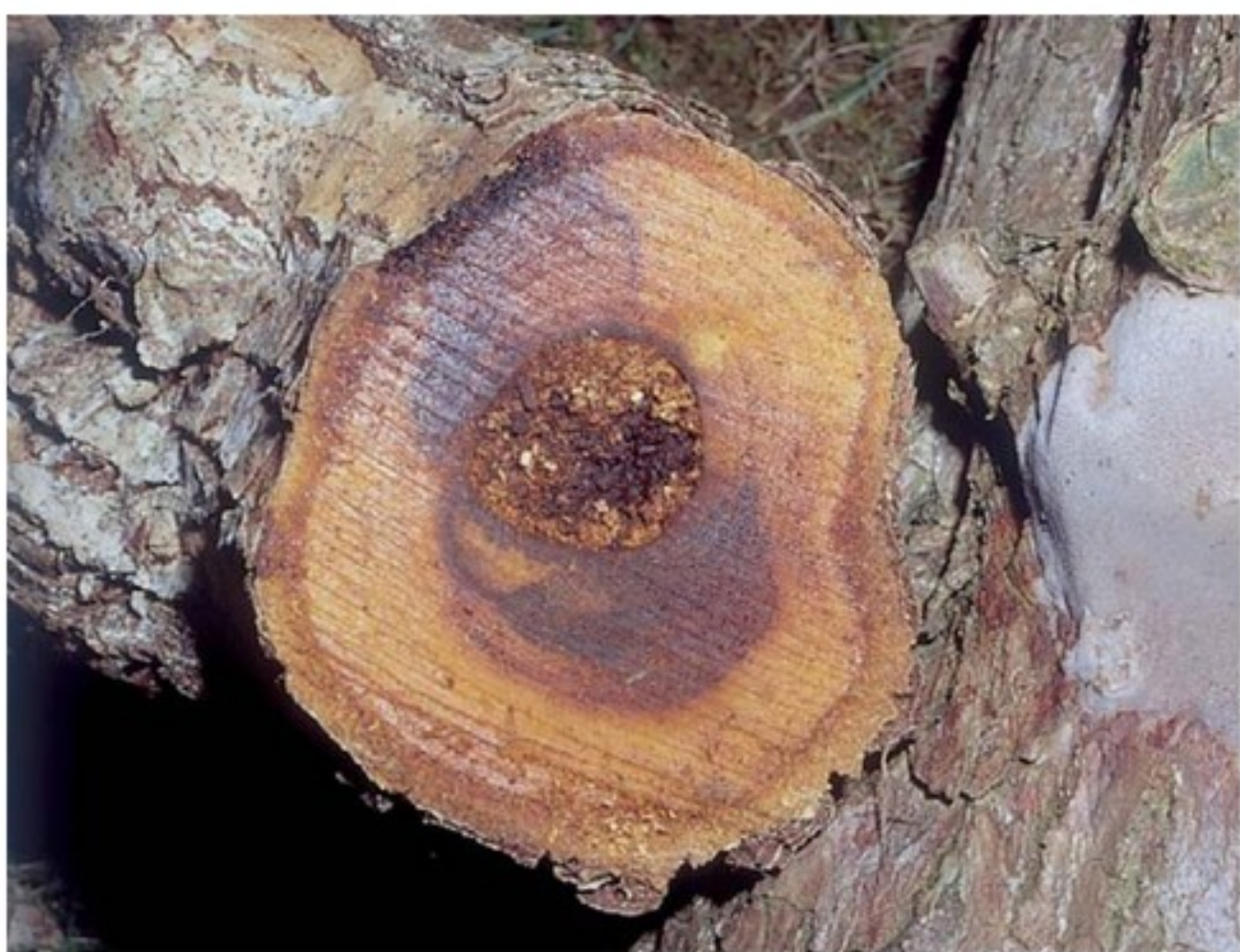
Processo di carie e corpo fruttifero biancastro (a destra)