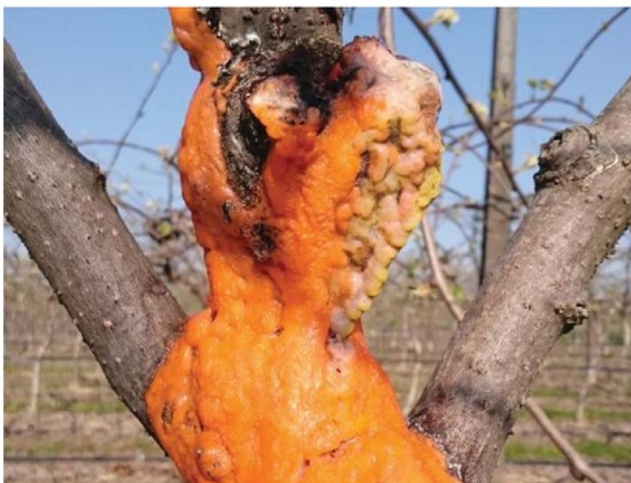
Fusto con gommosi carnicina