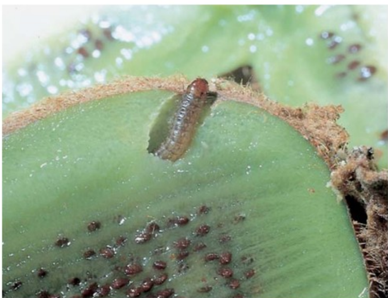
Frutto danneggiato dalla piralide