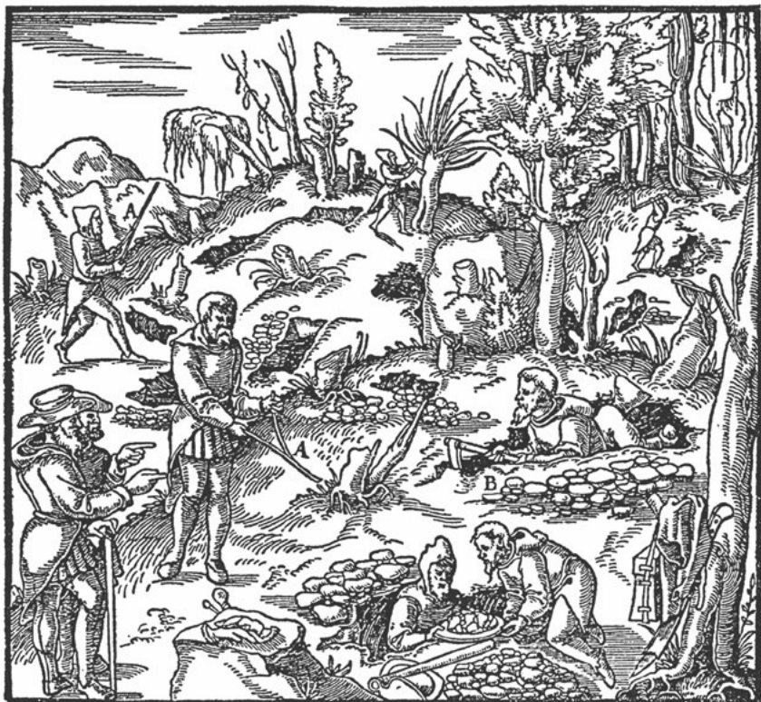
Xilografia dal De re metallica che raffigura rabdomanti al lavoro.

rabdomanzia per rintracciare criminali ed eretici, ma l'abuso di questo metodo portò nel 1701 a un decreto dell'Inquisizione che ne impediva l'utilizzo a fini di giustizia.