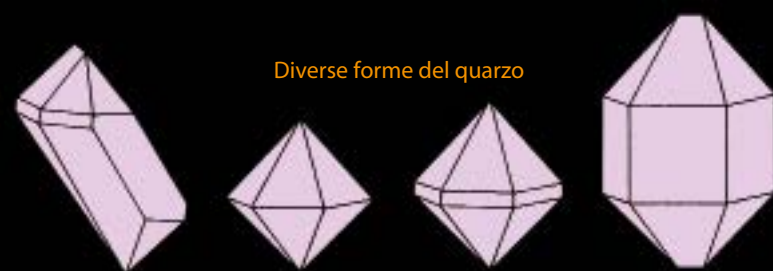
Diverse forme del quarzo

L'ultima fatica che si presenta al collezionista è quella di inserire i minerali nella collezione. Una volta identificati e puliti, essi saranno provvisti di un'etichetta che porti il nome, la descrizione, il numero di inventario e il luogo in cui sono stati reperiti. Tutti questi dettagli dovranno essere scritti con chiarezza. Inoltre, per evitare confusioni, bisogna scrivere, direttamente sul minerale e con uno strumento adeguato, il numero di inventario: tutta la collezione deve avere un catalogo nel quale i minerali siano descritti e identificati con il loro numero di inventario. Alcuni collezionisti aggiungono anche una documentazione fotografica. L'elaborazione di una buona collezione deve conformarsi a criteri tanto estetici quanto scientifici. I minerali devono essere collocati su piccole basi di legno o plastica o, meglio ancora, in cassette di plastica trasparente. Conviene ricordare che alcuni minerali sono sensibili all'azione della luce, all'umidità ecc., e agire di conseguenza.